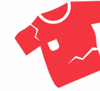
ਖਰਾਬ ਹੋਏ ਕੱਪੜੇ