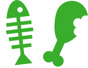
ਮੀਟ ਅਤੇ ਸਮੁੰਦਰੀ ਭੋਜਨ