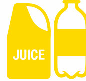
ਪਲਾਸਟਿਕ ਦੀਆਂ ਬੋਤਲਾਂ ਅਤੇ ਡੱਬੇ